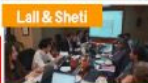
Lall & Sheti